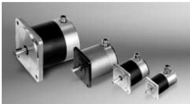
SM 168 SM 107 SM 87/88 SM 56

Sämtliche Kurven wurden unter Verwendung von STÖGRA Ansteuereinheiten gemessen.